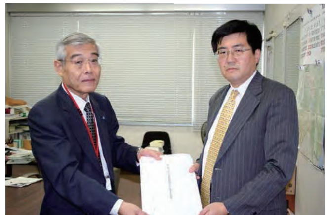
左から 柳田税制委員長、木村事業環境部長