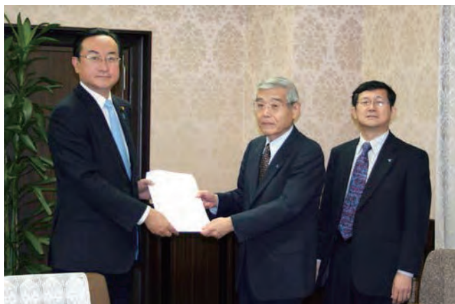
左から 岡田財務副大臣、柳田税制委員長、横山専務理事