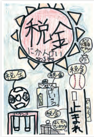
川崎市立東門前小学校6年