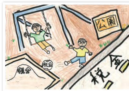
川崎市立東門前小学校6年