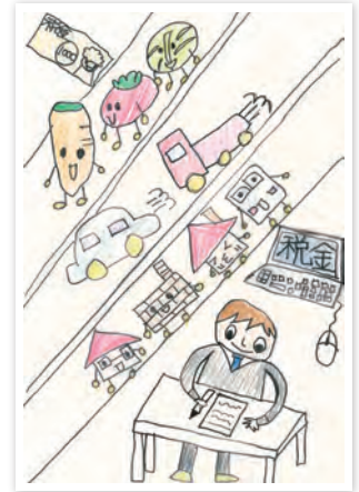
川崎市立東門前小学校6年