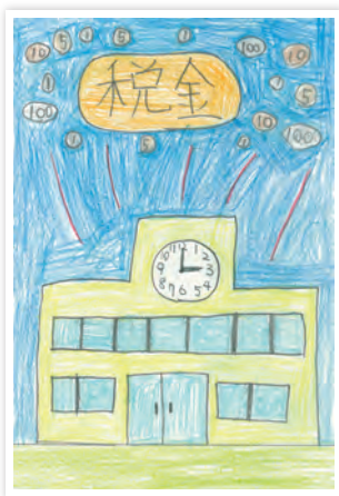
川崎市立東門前小学校6年