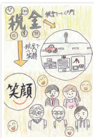
川崎市立東門前小学校6年