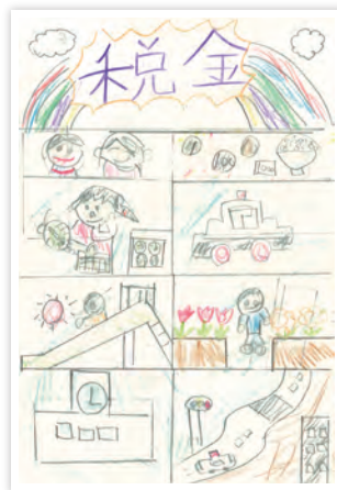
川崎市立川崎小学校4年