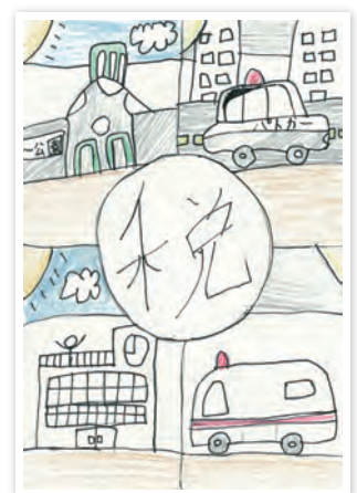
川崎市立東門前小学校6年