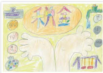
川崎市立宮前小学校5年