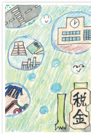
川崎市立日吉小学校6年