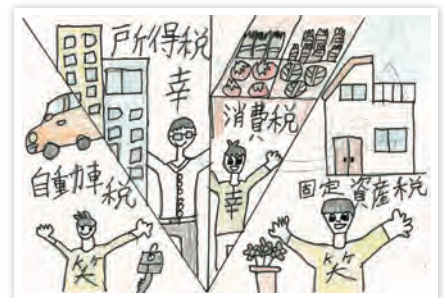
川崎市立東門前小学校6年