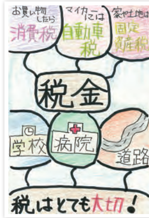
川崎市立東門前小学校6年