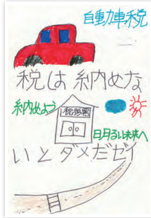
川崎市立日吉小学校6年