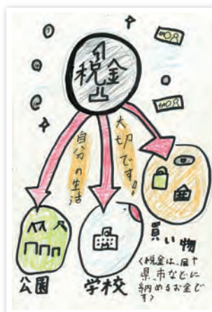
川崎市立東門前小学校6年